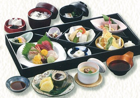
こちょう 胡蝶 5,500円(税別)〈税込 6,050円〉