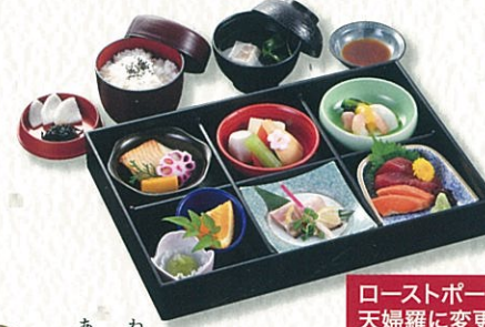
あわ 阿波 3,500円(税別)〈税込 3,850円〉