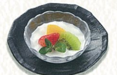
杏仁豆腐 400円(税別)〈税込 440円〉