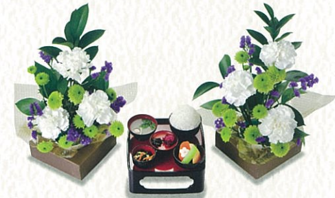
お花無し 1,000円(税別)〈税込 1,100円〉