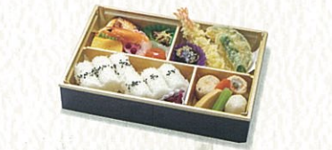
あかね 茜 2,300円(税別)

お持ち帰りの場合 〈税込 3,456円〉 各施設内でお召上げの場合 〈税込 3,520円〉