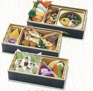
きしょう 桔梗 4,200円(税別)

お持ち帰りの場合 〈税込 5,616円〉 各施設内でお召上げの場合 〈税込 5,720円〉