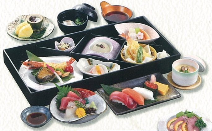
てんじん 天神 6,500円(税別)〈税込 7,150円〉