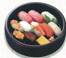
にぎり寿司 (1人前・吸物付) 3,600円(税別)〈税込 3,960円〉