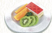
デザート盛合せ 1,200円(税別)〈税込 1,320円〉