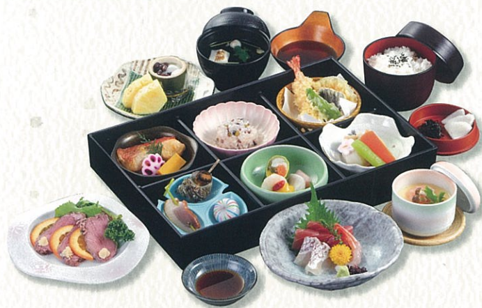
さらさ 更紗 6,500円(税別)〈税込 7,150円〉