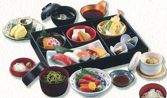
るり 瑠璃 4,500円(税別)〈税込 4,950円〉

「茶そば(冷)」は「うどん(温/冷)」に変更できます。※1種類にてお願い致します。