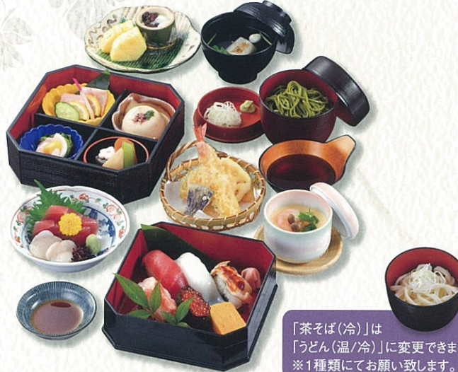
したん 紫檀 5,500円(税別)〈税込 6,050円〉

「茶そば(冷)」は「うどん(温/冷)」に変更できます。※1種類にてお願い致します。