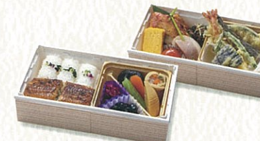
つばき 椿 3,200円(税別)

お持ち帰りの場合 〈税込 4,536円〉 各施設内でお召上げの場合 〈税込 4,620円〉