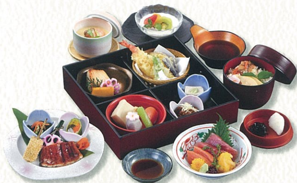
はつね 初音 5,000円(税別)〈税込 5,500円〉