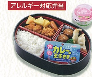
アレルギー対応弁当 【低アレルギー】 お子様幕の内 2,200円(税別)〈税込 2,420円〉 ※特定原材料7品目 えび、かに、小麦、そば、卵、牛乳、落花生/不使用