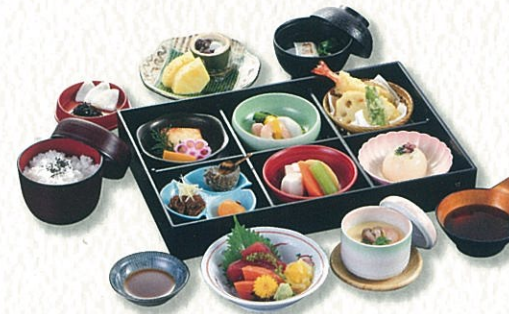
げんじ 源氏 4,500円(税別)〈税込 4,950円〉