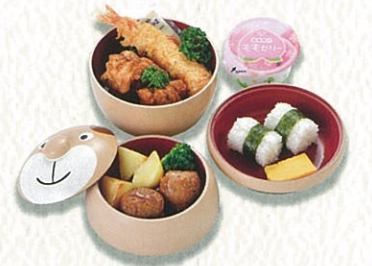
くまさん弁当 1,500円(税別)〈税込 1,650円〉