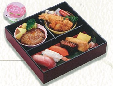
お子様寿司御膳 2,500円(税別)〈税込 2,750円〉