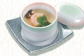
茶碗蒸し 500円(税別)〈税込 550円〉